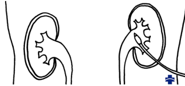
Kuva 1. Munuaiskatetri.

Sinulle on laitettu katetri (letku) ihon läpi munuaiseen ____ . ____ . 20 ____ . Munuaiskatetria voidaan kutsua myös pyelostoomaksi tai punktionefrostoomaksi. Sillä varmistetaan virtsan esteetön kulku ulos munuaisesta, jos virtsaneritys normaalia tietä virtsanjohtimen kautta virtsarakkoon on estynyt.